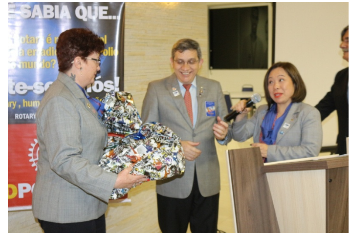
Presidente Leila e o casal Governador trocam presentes durante a reunião.