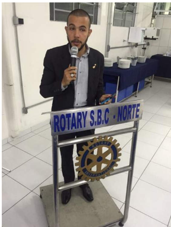
Dohny falou na tribuna sobre o RYLA 2016.