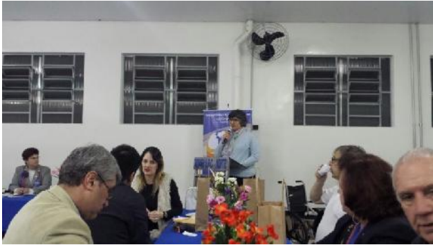
Presidente da Divisão Guaianases de Escoteiros de São Bernardo do Campo. Divisão esta fundada pelo RC SBC.