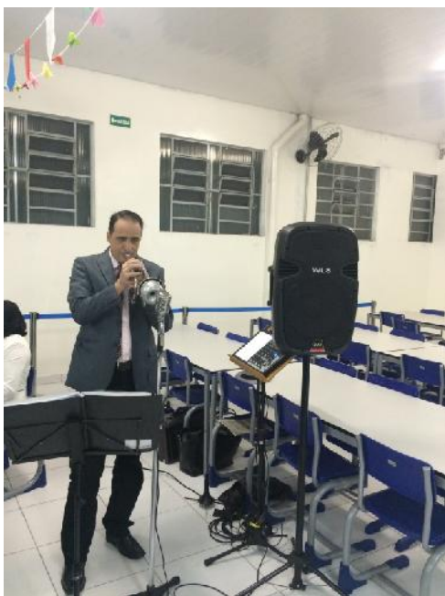
Nesta primeira reunião, o Soft Jazz da orquestra Versolatto, abrilhantou a noite.