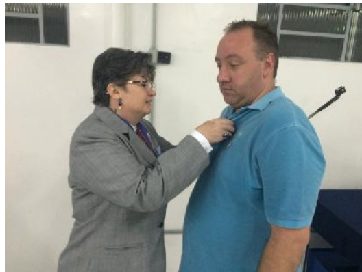
Odirlei Júnior, Imagem Pública.