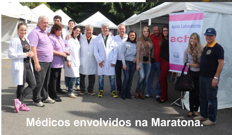
Médicos envolvidos na Maratona.