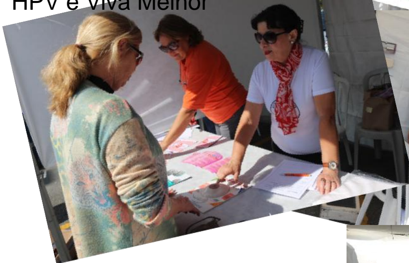
HPV e Viva Melhor