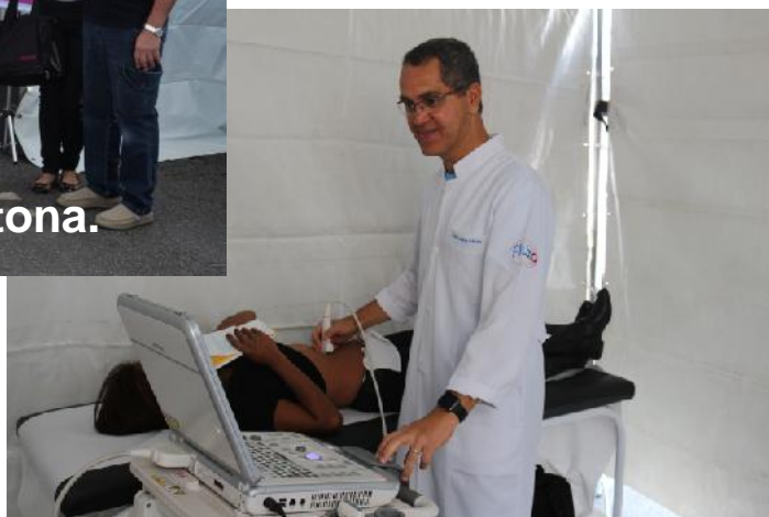
Ultrassonografia de Abdômen