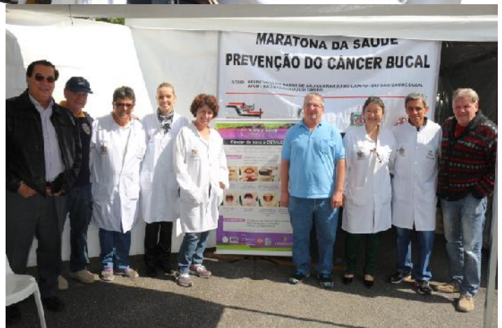
Prevenção do câncer bucal

Com a missão cumprida, os companheiros já começam a pensar no ano que vem na XX Maratona. Contamos com o apoio e a presença de todos !