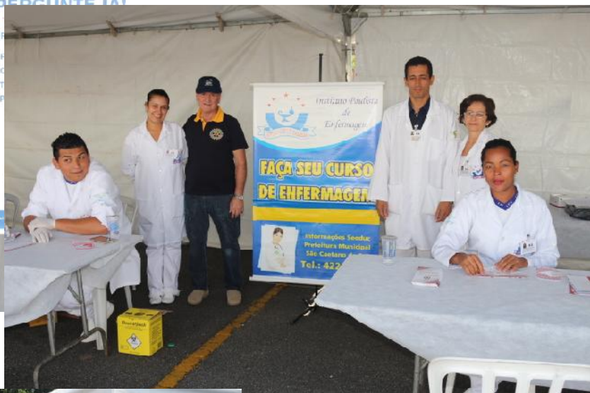
Teste de Hepatite C