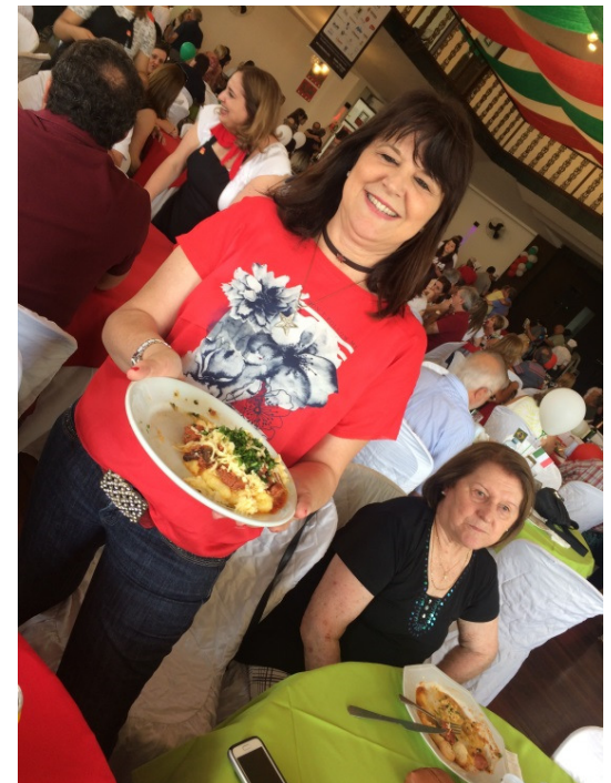
Acima: Feijoada do RC de SBC no CAMP. Abaixo: 10º Polenta Veneta do RC de Santo André Sul.