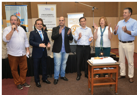
Aniversariantes de maio