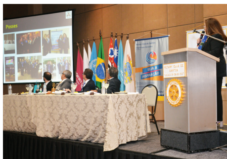
Momento do "Minuto Rotário"