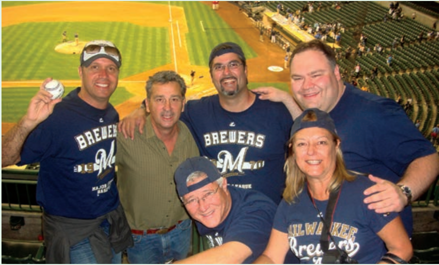
Intercâmbio da Amizade realizado para os EUA em Jun/2012

O Intercâmbio Rotário da Amizade (Rotary Friendship Exchange - RFE) voltou com força total aos programas encampados pelo Distrito 4420. Desde a última gestão em que a comissão foi ativada com força plena, quando o primeiro grupo distrital visitou o Distrito 6250 em Wisconsin/EUA, com a vinda dos americanos logo após em uma parceria de muito sucesso, o programa promete muitos frutos daqui pra frente.