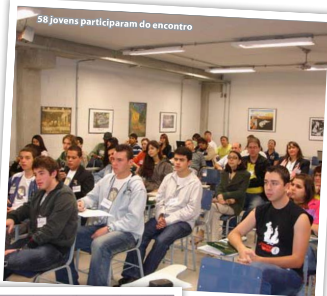
58 jovens participaram do encontro