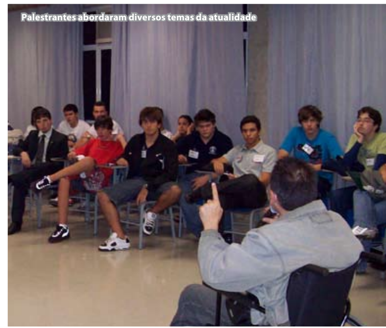
Palestrantes abordaram diversos temas da atualidade