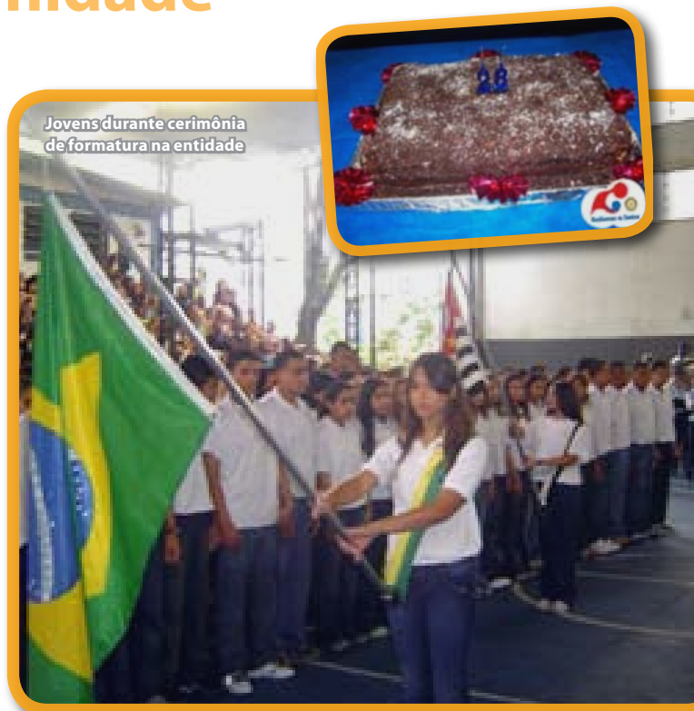
Jovens durante cerimônia de formatura na entidade

Para a direção da entidade, o mais importante do evento foi “a participação dos jovens e o espírito de fraternidade e amizade que se estabelece na organização das equipes e a contribuição da entidade para a formação integral do jovem cidadão”.