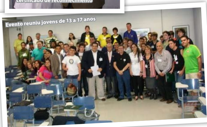
Evento reuniu jovens de 13 a 17 anos