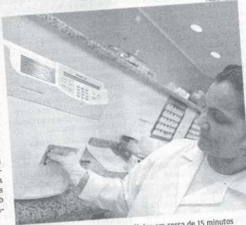
Equipamento faz a contagem das células em cerca de 15 minutos